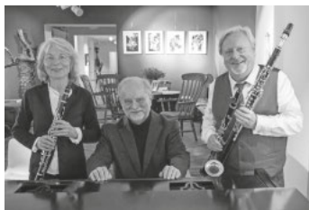
HerzRaumMusik