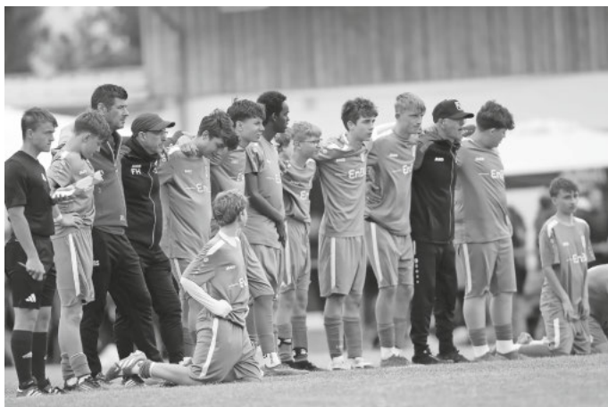
Unsere Mannschaft im Elfmeterschießen

Ein riesiges Dankeschön an die Jungs, das Trainerteam und die vielen Fans, die das Stadion in eine fantastische Kulisse verwandelt haben. Dieses Finale bleibt in Erinnerung.