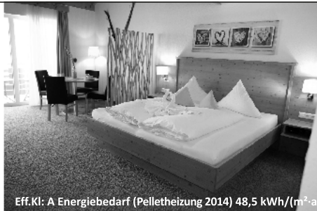
Eff.Kl: A Energiebedarf (Pelletheizung 2014) 48,5 kWh/(m²·a)

Immobilien- & Sachverständigen-Büro Bahnhofstraße 4 D-79868 Feldberg Telefon: 07655-1521 www.dahoim-immobilien.de