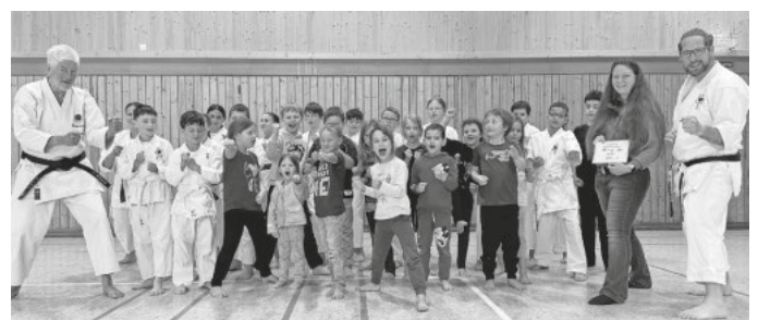
Die Kinder/Jugendgruppe des HakuRyûKan