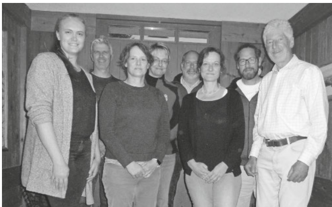
Unser Foto zeigt Vorstand und Abteilungsleiter (es fehlen F.Wehrle und R. Lohrer)

Die Karateabteilung freut sich über rege Nachfrage und Trainingsbeteiligung. Zahlreiche nationale und internationale Erfolge im Jugend- und Erwachsenenbereich krönen die Bilanz, was auch in der jährlichen Sportlerehrung der Gemeinde seinen Niederschlag fand. Daneben fand ein wohlgefülltes Jahr mit großen und gut besuchten Lehrgängen, Karatekino, Wandertag, Kinder- und Jugendwochenende im Leistungszentrum, Theaterbesuch sowie zahlreichen Lehrgangsbesuchen statt.